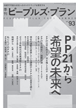
②「季刊ピープルズプラン93号 PP21から希望の未来へ」(ピープルズプラン)

全体にたくさんのカラー写真を取り入れ、歴史・理論・記録から訴訟に至った理由がはつきりと伝わってきます。