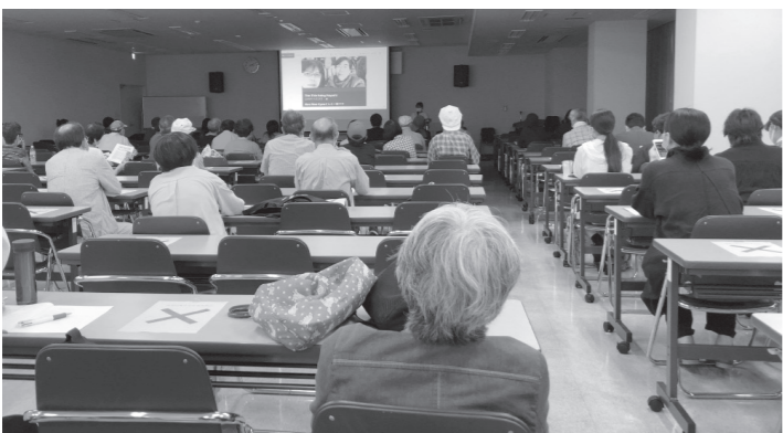
↑上映会後の講演会。できる限りの感染対策を行った(自治労会館)。

秀でも、一政党が優秀でも、民主主義にはならない。国民みんなが求めることで民主主義を実現することができる」というお話に、わたし自身勇気づけられる思いがした。北海道という土地で共に生活している彼・彼女たちがどのような悲しみの中にいるのか、わたしには想像することしかできないが、異国から来た彼・彼女らが安心して暮らせる社会を作りたい。まずは隣人のために、ミャンマー民主化支援をしていきたいと思う。