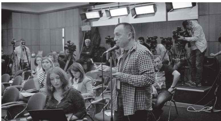
↑映画「コレクティブ 国家の嘘」より

もう一つは、私自身も3年前から作品の制作を再開し、今年はその頃から企画していた中編映画「waka」(アイヌ語で水を意味します)を制作中です。夏の撮