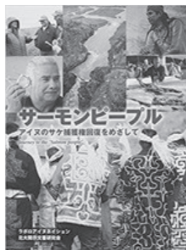
①「サーモンピープル アイヌのサケ捕獲権回復をめざして」(ラポロアイヌネーション、北大開示文書研究会)

2020年ラポロアイヌネーション(旧浦幌アイヌ協会)は、国と北海道に対しサケ捕獲権確認請求をしました。そこに至るまでの記録です。