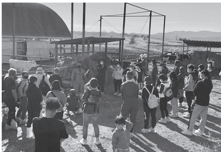
アニマルウェルフェア牧場見学会より（2021年10月9日、妹背牛牧場）